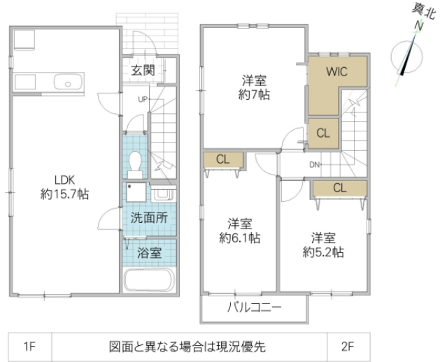
1F 図面と異なる場合は現況優先 2F